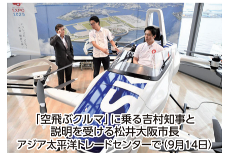
「空飛ぶクルマ」に乗る吉村知事と説明を受ける松井大阪市長 アジア太平洋トレードセンターで(9月14日)

最新機は一人乗りで自動車ほどの大きさ。ドローンのように垂直で離着陸でき、最高時速40~50km、5~10分連続で飛べる。