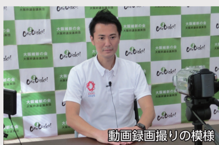
動画録画撮りの模様

ホテルやレストラン、ショッピングモール、エンターテインメント施設、国際会議場・大規模展示場、カジノ等の施設を一体的に整備。経済波及効果や雇用の拡大などが見込めるほか、地元企業の商品を活用したビジネス機会の創出にもつながるなどの期待もある。