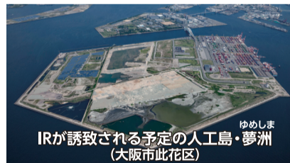
IRが誘致される予定の人工島・夢洲(大阪市此花区)

今後、府・市と同グループは、基本協定を締結後、2022年4月28日までに国に区域整備計画の認定申請を行います。初期投資を含めて1兆円規模投資を計画し、2020年代後半の開業を目指しています。