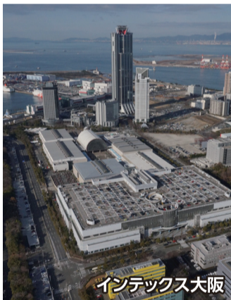
インテックス大阪

【全体の予算見込額】約84億円(うち初期費用約33億円を9/14付けで専決処分)